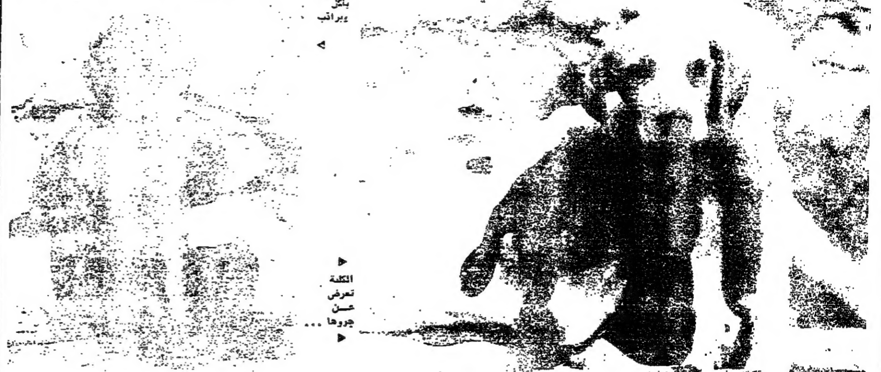
الطفل يتل ويراقب